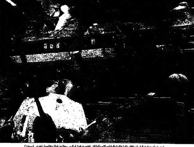
أحد خبراء حركات التحرير يقف في جوارها بالنادي الأمريكي التي تعبر فوق لوكربي بحثا عن ملقاة وتفاصيل لوكربي (روندا)

دمشق- من عصام حمزة- انعقد المجلس الشعبي السوري الجديد في دمشق صباح اليوم الأربعاء 28 تشرين الثاني 1998، برئاسة الرئيس بشار الأسد. وكان المجلس يضم 100 عضو، بينهم 50 من أعضاء المجلس النيابي السابق و50 من أعضاء المجلس الجديد.